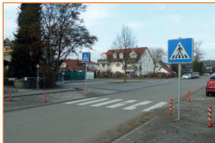
Fußgängerüberweg in der Wolfsgartenstraße