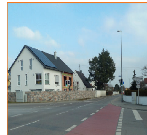
Fußgängerampel in der Wilhelm-Busch-Straße