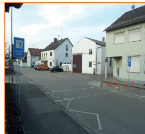
Verkehrshelferübergang in der Eichenwaldstraße